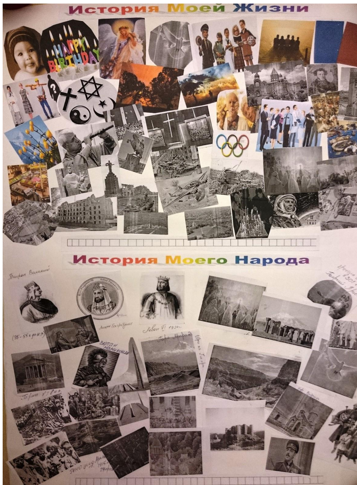
Рис. 1. Вертикальный вариант. Пример взаимопроникновения, интерференции символов в личном и этнокультурном хронотопах

При горизонтальной композиции хронометрическая линейка была единой для обоих хронотопов, кроме этого их единство задавалось самим названием: «История моей жизни и история моего народа (рис. 2).